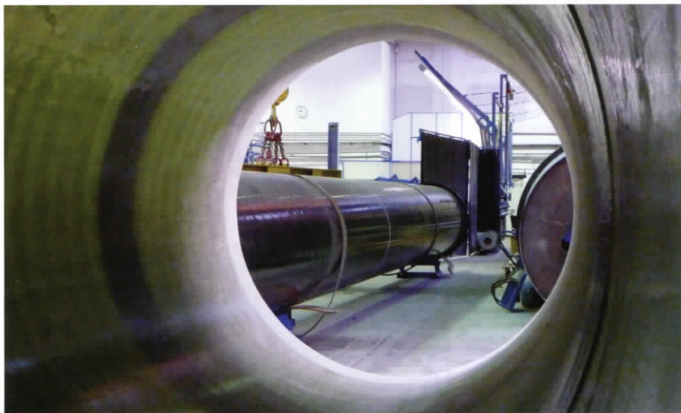
Ein Gasrohr in der Warteschlange. Sobald ein Rohr fertig gewickelt ist, liegt bereits das nächste parat