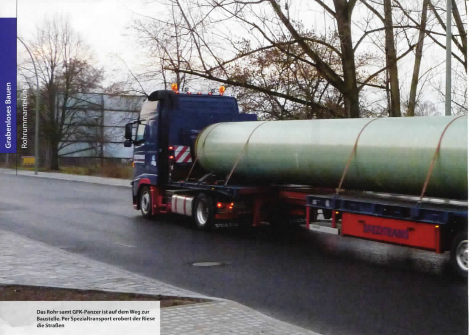
Das Rohr samt GFK-Panzer ist auf dem Weg zur Baustelle. Per Spezialtransport erobert der Riese die Straßen