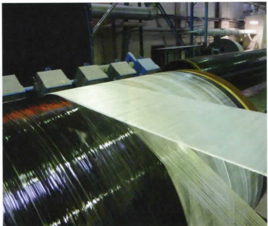
Die in Harz getränkten Glasfasern werden um das Gasrohr gewickelt

Bis dato war kein gängiges Prüfverfahren bekannt, um die gefundenen Rezepturen einer Tauglichkeit zu unterziehen. Parallel stand somit die Entwicklung einer objektiven Prüfmethode: Der Testkörper, ein mit GFK ummanteltes Stahlrohr, wurde auf einem Schlitten, welcher sich hydraulisch hin und her bewegte, befestigt. Ein gehärteter Stahlkörper – er simulierte die möglichen Gesteinsarten – wurde mittels Hebelarm auf den Prüfling gepresst. Um Verfälschungen der Prüfergebnisse zu vermeiden (z.B. Deformierung der Rohrwandung), wurde das Rohr eigens mit Polymerbeton gefüllt. Um die Prüfergebnisse der neuen GFK-Schutzhülle realistisch bewer-